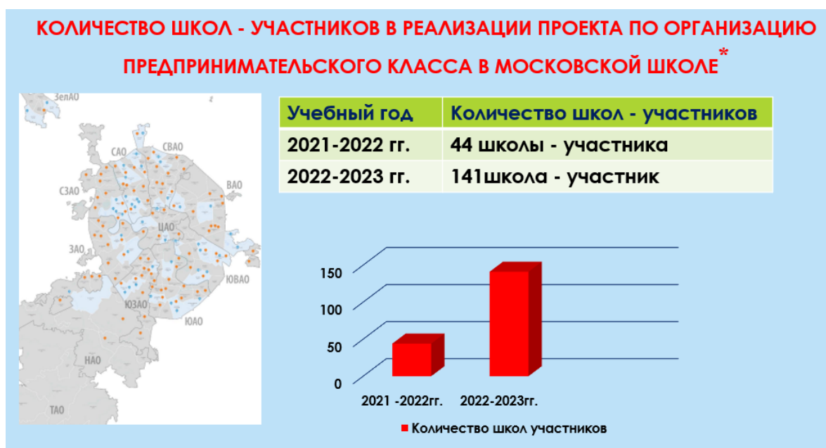
Рисунок 1 – Динамика реализации проекта по организации предпринимательского класса в школах г. Москвы (по данным департамента образования и науки города Москвы)

Данный проект включает в себя элементы предпрофессионального образования, которое направлено на формирования у обучающихся предпринимательского мышления. В процессе обучения школьники получают знания по проектному управлению, генерации бизнес-идей и созданию стартапов с целью последующего осознанного выбора будущей профессий в сфере предпринимательства.