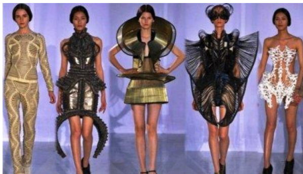
Рисунок 8 – Сюрреалистичный футуризм

Ретро-футуризм. Этот стиль создал французский кутюрье Пьер Карден. За основу он взял платья А-силуэта, которые были украшены геометрическими вырезами. Пако Рабану понравилась эта идея, и он тоже начал ее развивать. Он использовал инновационные материалы, такие как пластик или летнее платье, для изготовления одежды. Сегодня ретро-футуризм проявляется в моде на изделия архитектурного и геометрического кроя, использование металлизированных тканей и т.д. (рисунок 9).