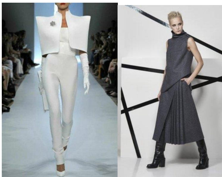
Рисунок 7 – Футуризм-минимализм

Футуризм-минимализм. Этот стиль основан на стиле унисекс. В этом стиле есть одежда с элементами андрогинности. Такую одежду могут носить как женщины, так и мужчины. Сюда входят спортивные костюмы с металлическими или металлическими элементами, большие худи и т.д. Их можно носить в повседневной жизни (рисунок 7).