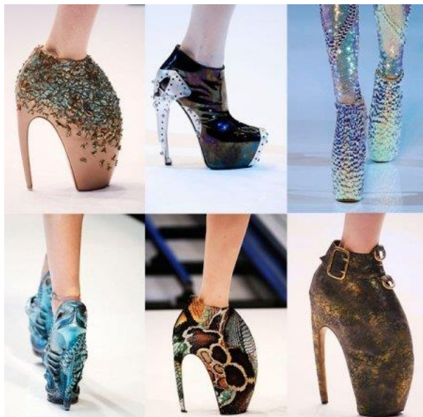
Рисунок 2 – Александр Маккуин. Туфли-копыта.

Французский модельер Николя Жескьер создал для бренда Balenciaga футуристическую коллекцию, в которой пастельные и яркие цвета удачно сочетаются с цветами металлик (рисунок 3).