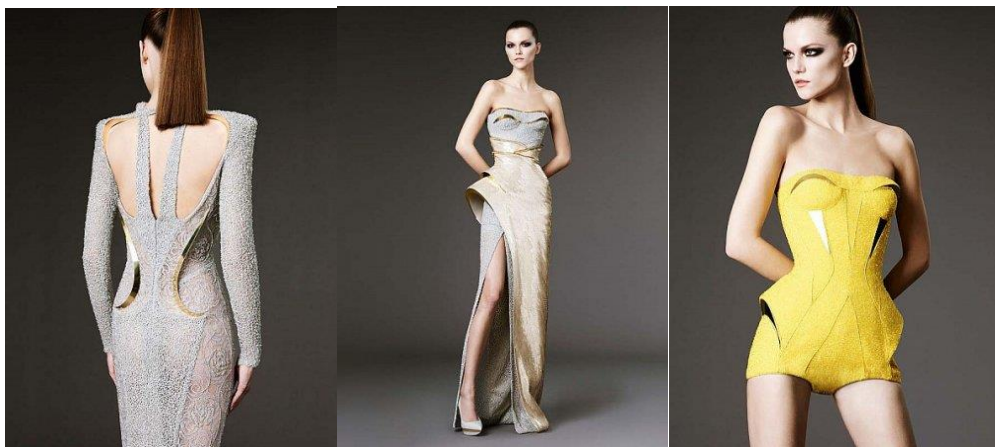
Рисунок 4 – Коллекция дома Versace

Также заслуживают внимания смелые эксперименты с нетрадиционными материалами – Color-In-Dress от Berber Soepboer и Michiel Schuurman (набор цветowych маркеров прилагается к Color-In-Dress), «мясное платье» Леди Гага от Nicolas Formichetti, платье Gras авторства художника Робина Баркуса Слонины, свадебное платье из туалетной бумаги от Лауры Гоун, Сьюзан Бейн и Рокси Рэдфорд, платье-баллон от Daisy Balloon, бумажные платья от Мэттью Броди (рисунок 5).