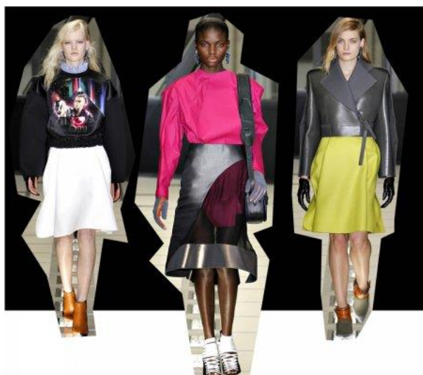
Рисунок 3 – Николя Жескьер. Футуристическая коллекция.

Французский модельер Николя Жескьер создал для бренда Balenciaga футуристическую коллекцию, в которой пастельные и яркие цвета удачно сочетаются с цветами металлик (рисунок 3).