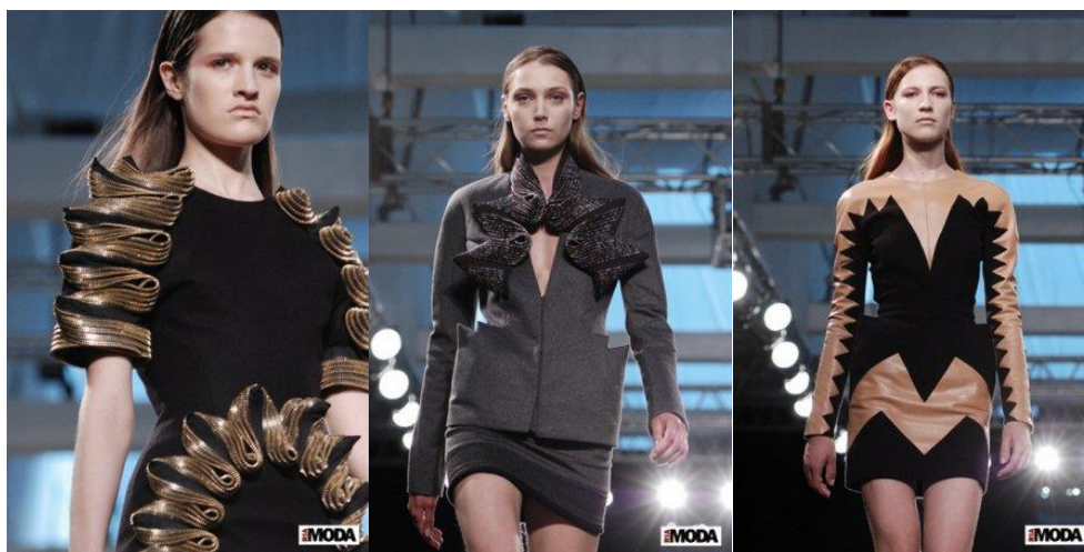
Рисунок 1 – Давид Кома. Коллекция платьев

Грузинский модельер Давид Кома создал отличную коллекцию, которую представил на Aurora Fashion Week. В этой коллекции он представил платья на заказ с заклепками на бедрах и плечах, геометрическими элементами и зигзагообразными принтами. Он использовал такие цвета, как серый, черный, бежевый и золотой (рисунок 1).