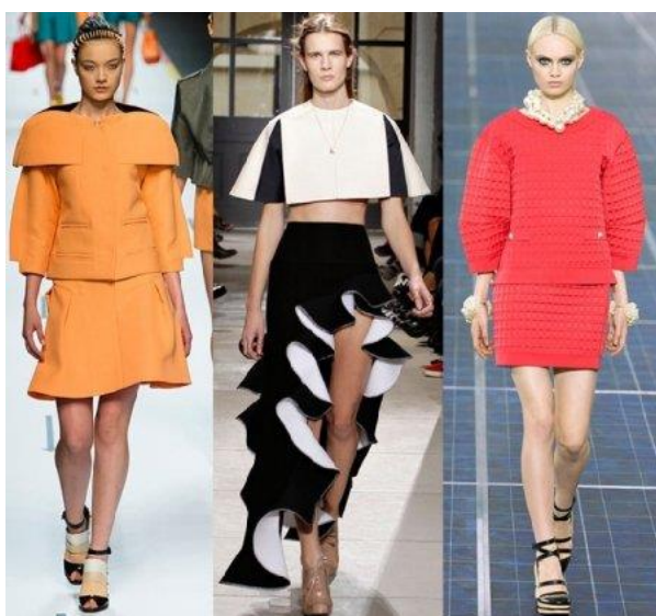
Рисунок 9 – Ретро-футуризм

Ретро-футуризм. Этот стиль создал французский кутюрье Пьер Карден. За основу он взял платья А-силуэта, которые были украшены геометрическими вырезами. Пако Рабану понравилась эта идея, и он тоже начал ее развивать. Он использовал инновационные материалы, такие как пластик или летнее платье, для изготовления одежды. Сегодня ретро-футуризм проявляется в моде на изделия архитектурного и геометрического кроя, использование металлизированных тканей и т.д. (рисунок 9).