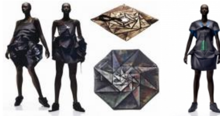
Рисунок 6 – Иссэй Мияке. Коллекция одежды, которая трансформируется из двухмерной геометрической формы в объем

Технологии не стоят на месте – уже появилось вполне съедобное белье, духи с запахом целлофана и одежда-трансформер.