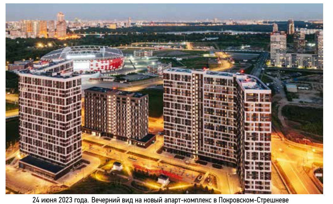
24 июня 2023 года. Вечерний вид на новый апарт-комплекс в Покровском-Стрешнево