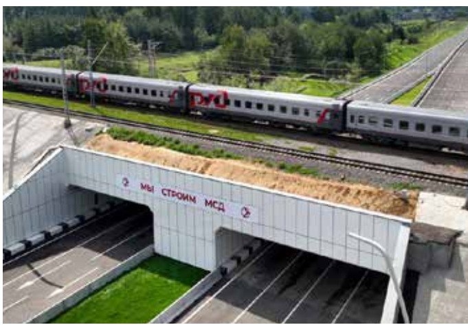
2 августа 2023 года. Открытие южного участка МСД

ремонта, а также переоборудования медицинских учреждений для установки компьютерных томографов, аппаратов МРТ, маммографов, ангиографов и денситометров.