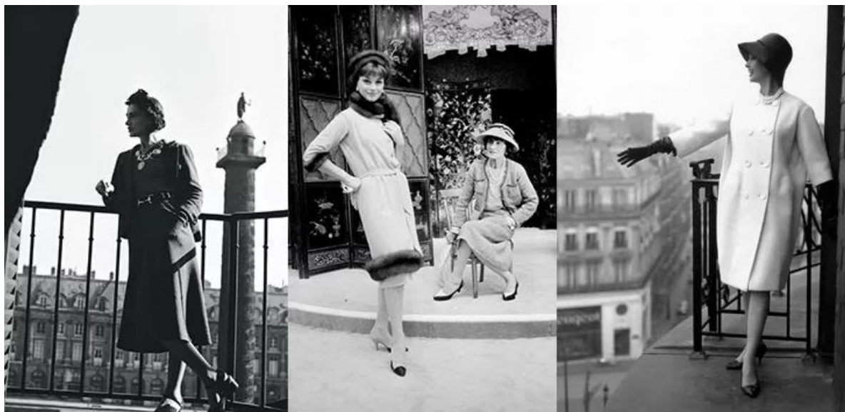
Рисунок 9 - Модели Chanel

Именно она ввела моду на женские брючные костюмы, на прямые юбки-карандаши в сочетании с блузками и жакетами и, конечно, на знаменитое маленькое черное платье. Такая одежда придала женщинам больше уверенности, элегантности, строгости. Самыми известными последовательницами классического стиля после Коко Шанель стали Одри Хепберн и Маргарет Тэтчер. Их образы до сих пор считаются иконами классического стиля, многие берут с них пример.