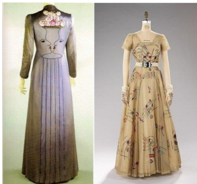
Рисунок 1 – Изделия Эльзы Скиапарелли