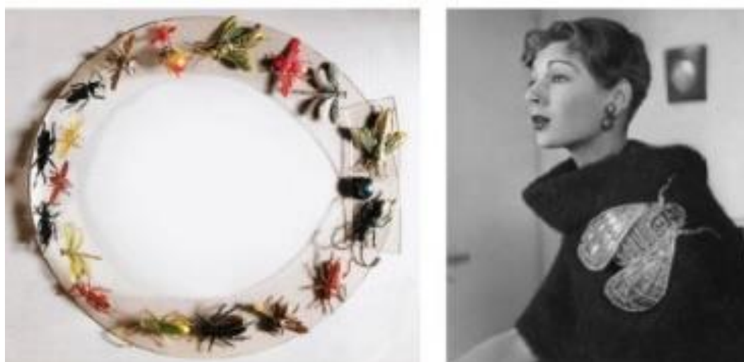
Рисунок 8 – Ювелирные изделия Эльзы Скиапарелли, вдохновленные насекомыми