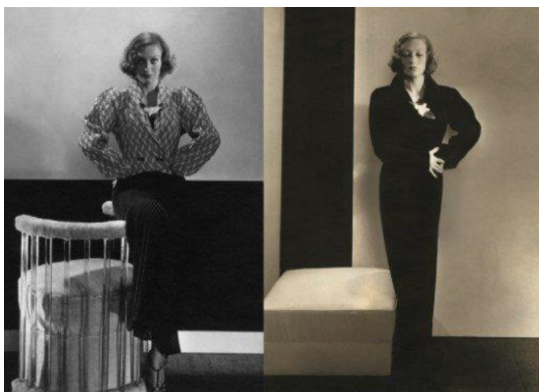
Рисунок 6 – Изделия с объемными рукавами

Скиапарелли находила вдохновение в геометричных силуэтах формы пилотов. Первые жакеты с увеличенными плечами появились под влиянием этой страсти модельера, а созданный ею стиль «пилот» актуален до сих пор.