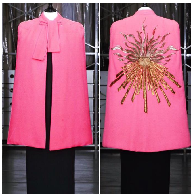
Рисунок 7 – Жакет от Эльзы Скиапарелли

Любимый цвет Эльзы – розовый. Этот цвет она использовала для всего: от упаковок до богато расшитых вечерних платьев. Когда она совместно со своими творческими друзьями занялась парфюмерией, розовый цвет и здесь присутствовал... Многие вещи, созданные ею, принесли ей успех и всемирную славу. Эльза в своих коллекциях использовала обычные предметы, но в совершенно другом контексте, что называется сюрреализмом. Как говорила сама Эльза, что для неё слово «невозможно» не существует. Поэтому аспирин мог превратиться в ожерелье, а обыкновенные жуки и пчёлы служили для модных украшений.