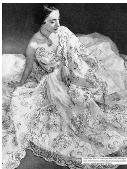
Рисунок 2 – Расшитое платье от Эльзы Скиапарелли

Стоит также упомянуть, что сокращенное от фамилии известное прозвище дизайнера, Скиап, Эльза придумала сама.