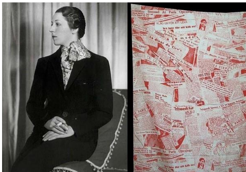
Рисунок 5 – Газетный принт

Именно Эльза Скиапарелли решила наносить на одежду газетный принт. В 1935 г. кутюрье взяла вырезки из прессы, написанные о ней, и применила их для украшения блузок, шарфов и платьев. В своей автобиографичной книге («Shocking Life», 1954 г.) дизайнер отметила, что эта идея возникла во время поездки в Копенгаген, где она увидела местных женщин в шляпах из газеты. Позже трюк с газетным принтом прославил Джон Гальяно, использовав его в коллекции Dior Fall/Winter RTW 2000.