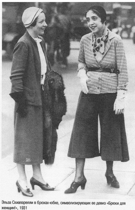
Эльза Скиапарелли в брюках-юбке, символизирующих ее девиз «Брюки для женщин!», 1931

Эльза обожала эпатировать публику. Причем делала это не только с помощью создания новых коллекций у себя в ателье, но и во время обычных прогулок — дизайнер на себе демонстрировала вещи, которые для ее времени считались неслыханной дерзостью и настоящим вызовом обществу.