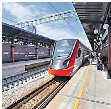
2 июня 2023 года. Открытие обновленной станции «Площадь трех вокзалов»

Запуск МЦД-4 все ближе — западный радиус почти готов. На Калужском направлении осталось завершить работы на одной из 16 станций — Солнечной. Остальные уже привели в порядок.