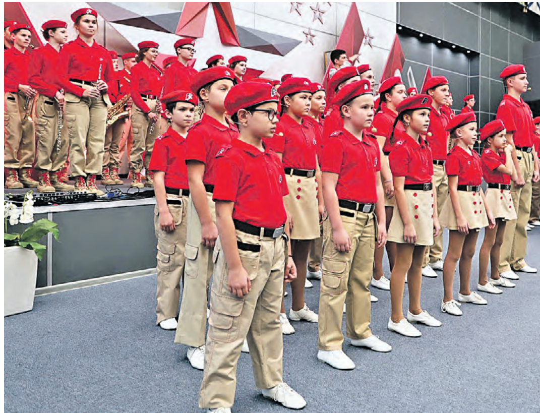
Больше половины состава ансамбля «Юные патриоты» — талантливые ребята из Центрального округа. Без их выступлений не обходится ни одно значимое событие в ЦАО

Каждый день в десяти районах ЦАО кипит жизнь. Как за всем уследить? Редакция «МЦ» решила это сделать в рубрике «Мой район». Мы рассказываем о самых интересных событиях и ярких коллективах в округе, а заодно делимся районными новостями.