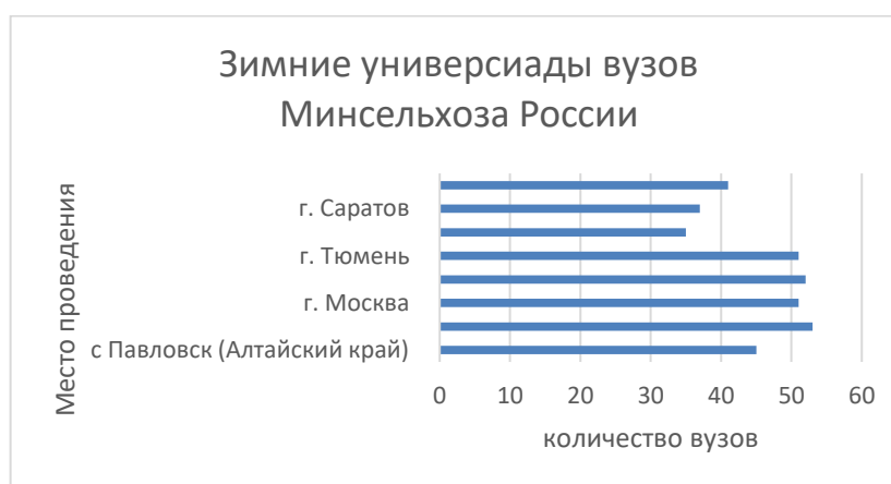
Рисунок 2 – Диаграмма количества вузов-участников летних универсиад

Что касается географии проведенных универсиад (рисунок 3), то мы видим, насколько она внушительна. Посредством участия в соревнованиях студенты путешествовали по всей России: г. Уфа, г. Саратов, г. Краснодар, г. Тюмень, г. Казань, г. Москва, Алтайский край, г. Самара, г. Новосибирск, г. Ижевск, г. Курган, г. Рязань. Обязательным мероприятием во время проведения соревнований является показ материально-технической и научной базы принимающего вуза, а также экскурсии по основным культурным достопримечательностям региона.