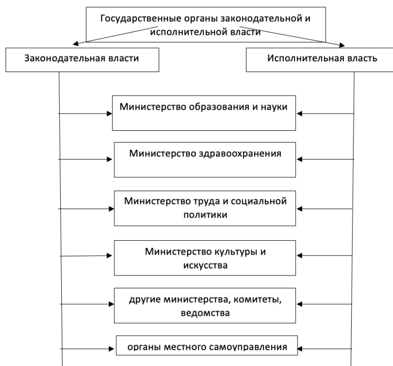
Рисунок 1 - Субъекты государственного регулирования безработицы населения [8, с. 59]

Схематично субъекты государственного регулирования рынка труда и безработицы представлены на рисунке 1.