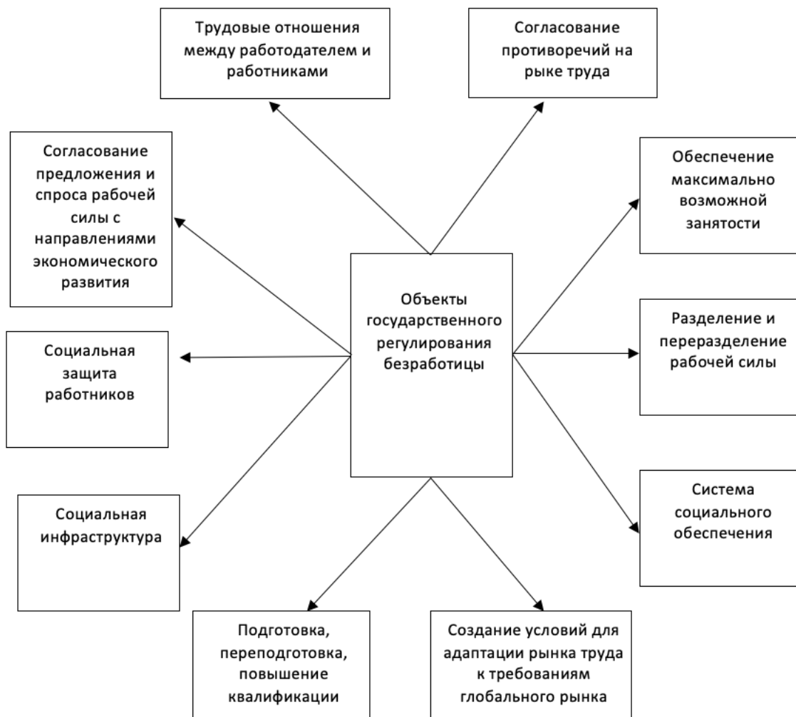
Рисунок 2 - Объекты государственного регулирования безработицы

Схематично объекты государственного регулирования безработицы можно представить в следующем виде (см. рисунок 2).