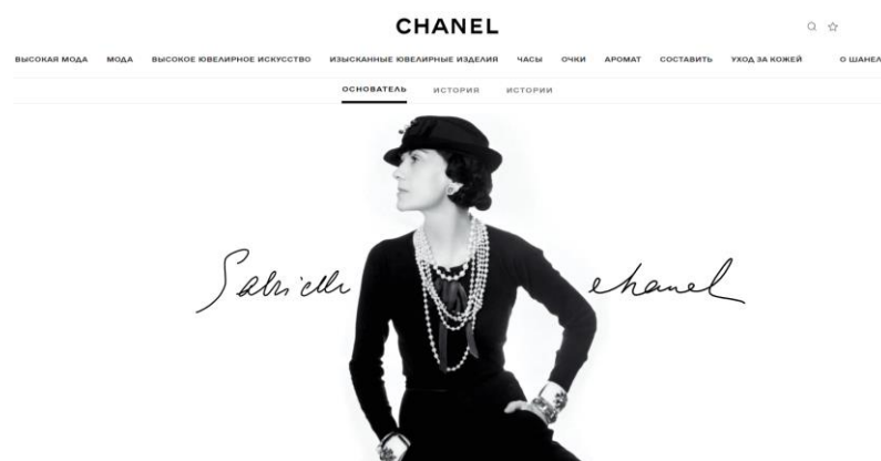
Рис. 3. Оформление главной страницы официального сайта бренда Chanel [36]

Если рисунок заимствован из учебника, монографии или научной статьи, то есть не является авторским, то ссылка на источник обязательна. В данном случае в квадратных скобках указан номер из списка литературы, под которым стоит название источника, и номер страницы, где приведен рисунок.