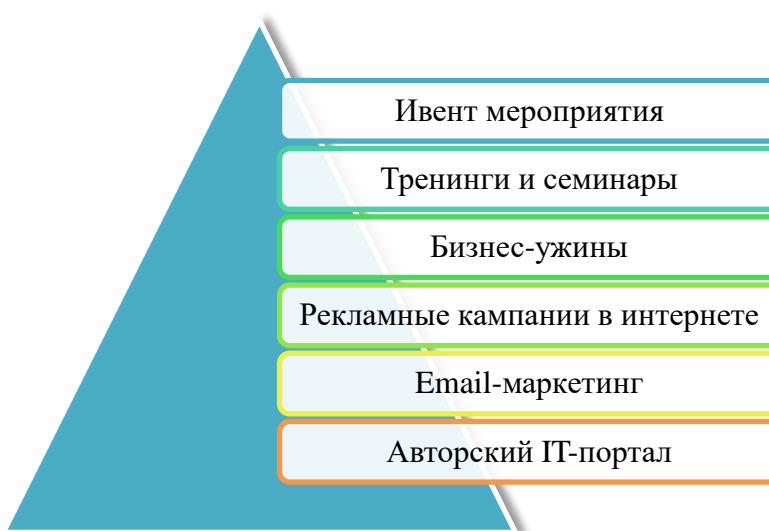
Рис. 1. Маркетинговая работа OCS