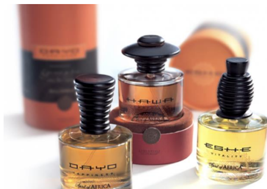
Рис.1. Пример айдентики линейки женской парфюмерии «Spirit of Africa» от бренда Atkinsons

Если рисунок заимствован из учебника, монографии или научной статьи и т.п., то есть не является авторским, то ссылка на источник обязательна. В данном случае в квадратных скобках указан номер из списка литературы, под которым стоит название источника, и номер страницы, где приведен рисунок.