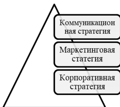
Рис.1. Соотношение стратегий предприятия

Если рисунок заимствован из учебника, монографии или научной статьи, то есть не является авторским, то ссылка на источник обязательна. В данном случае в квадратных скобках указан номер из списка литературы, под которым стоит название источника, и номер страницы, где приведен рисунок.