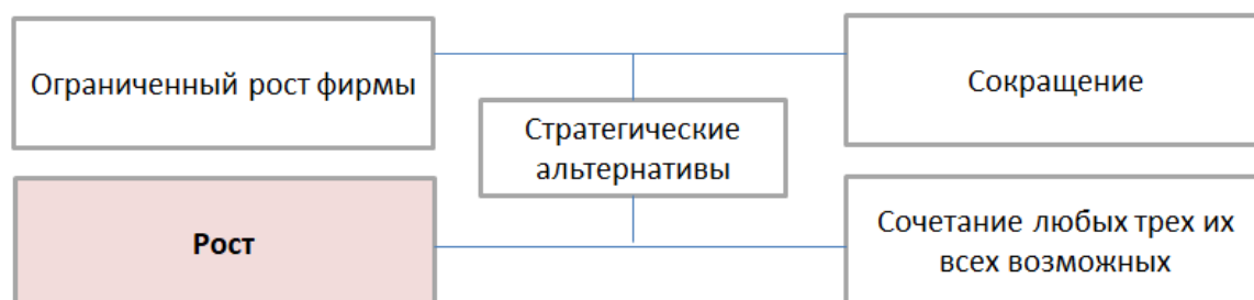
Рис. 2. Стратегические инициативы компании [8, с.12]

Если рисунок заимствован из учебника, монографии или научной статьи, то есть не является авторским, то ссылка на источник обязательна. В данном случае в квадратных скобках указан номер из списка литературы, под которым стоит название источника, и номер страницы, где приведен рисунок.