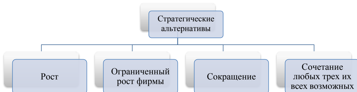
Рис. 2. Стратегические инициативы компании [8, с.12]

Если рисунок заимствован из учебника, монографии или научной статьи, то есть не является авторским, то ссылка на источник обязательна. В данном случае в квадратных скобках указан номер из списка литературы, под которым стоит название источника, и номер страницы, где приведен рисунок.