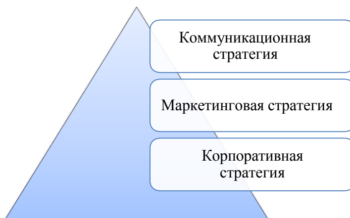
Рис.1. Соотношение стратегий предприятия