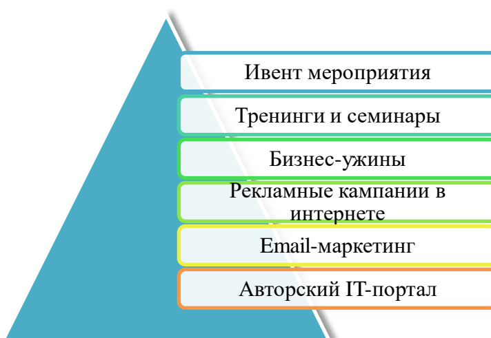
Рис. 1. Маркетинговая работа OCS