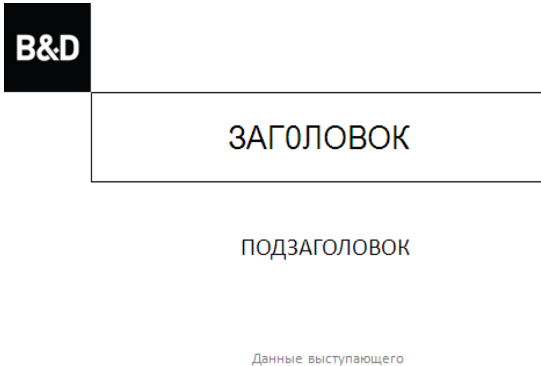
Рисунок 6.1– Образец слайда презентации