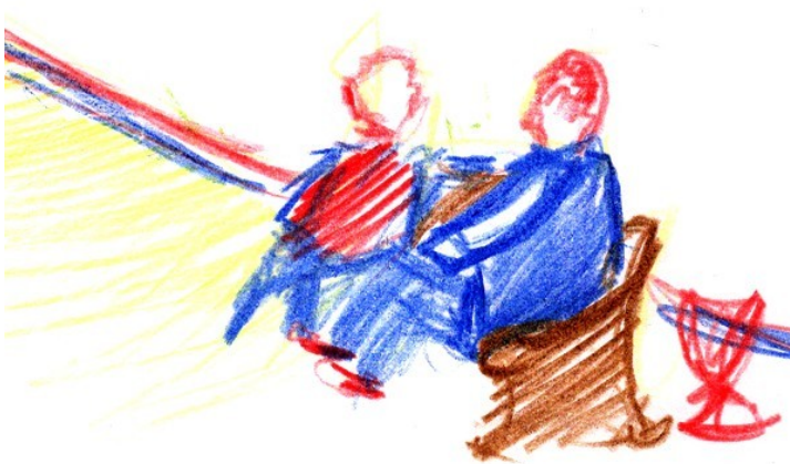
Рисунок 6.5 – Пример оформления задания в отчете (Сизова Дарья, ГД-б/16)