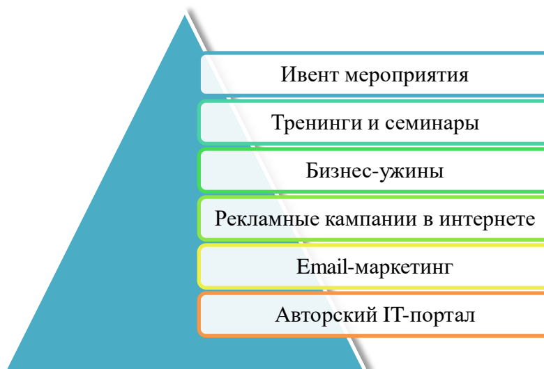
Рис. 1. Маркетинговая работа OCS