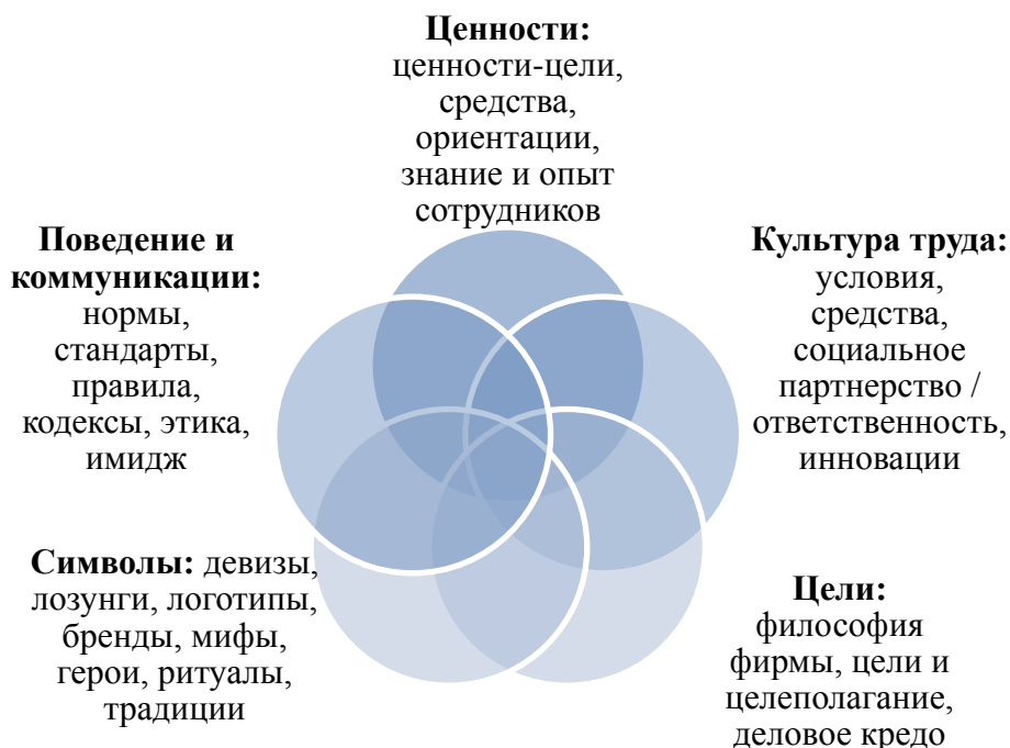
Рис.1. Основные элементы организационной культуры

По окончании прохождения практики, в срок не позднее 5-и календарных дней , студенты должны предоставить руководителю практики сформированный отчет о прохождении производственной практики.