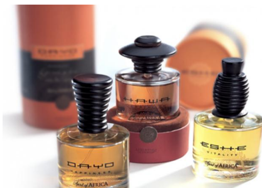
Рис.1. Айдентика бренда Wella Spirit of Africa

По окончании прохождения практики, в срок не позднее 5-и календарных дней , студенты должны предоставить руководителю практики сформированный отчет о прохождении производственной практики, преддипломной.